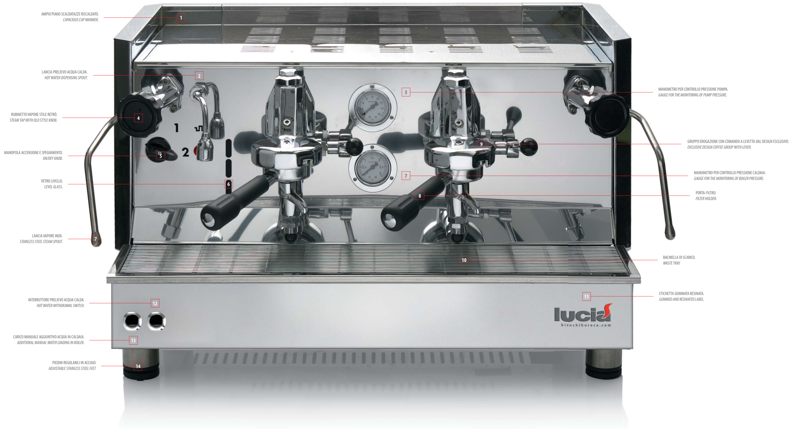
1 AMPIO PIANO SCALDATAZZE RISCALDATO. CAPACIOUS CUP WARMER.